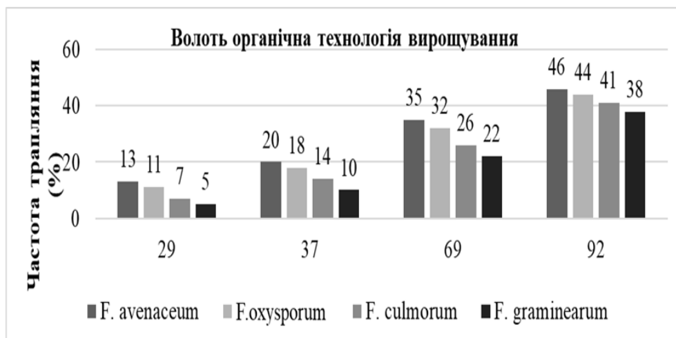
Рис. 1. Частота трапляння мікроміцетів на волоті вівса у різні фази онтогенезу: 29- завершення фази кушення, 37- поява останнього (прапорцевого) листка, 69- кінець цвітіння, 92- пізня повна стиглість. (за шкалою ВВСН).

За органічної технології вирощування у волоті вівса посівного виявлено чотири види мікроміцетів роду Fusarium ( F. oxysporum , F. graminearum , F. culmorum , F. avenaceum ) з частотою трапляння 5–46% (рис. 1).