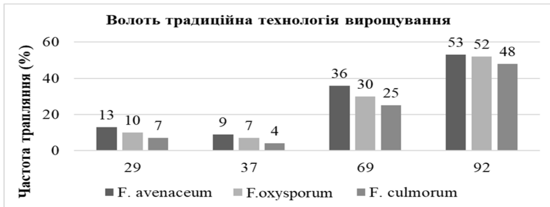
Рис. 2. Частота трапляння мікроміцетів на волоті вівса у різні фази онтогенезу: 29- завершення фази кушення, 37- поява останнього прапорцевого листка, 69- кінець цвітіння, 92- пізня повна стиглість. (за шкалою ВВСН).

За традиційної технології вирощування у волоті вівса посівного виявлено чотири види мікроміцетів роду Fusarium ( F. oxysporum , F. graminearum , F. culmorum , F. avenaceum ) з частотою трапляння 7–53%. Упродовж онтогенезу відзначено зниження поширення мікроміцетів у фазу прапорцевого листка, після застосування фунгіцидів, однак у фазах цвітіння та повної стиглості показники істотно зросли (до 50–53%). На всіх етапах розвитку домінував F. avenaceum , частота трапляння досягала 53%.